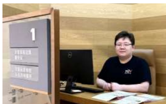
图八：“质量服务面对面”活动

2025年10月28日，TÜV奥地利前往临港新片区“走出去”综合服务平台线下公共服务办事大厅，围绕“产品出口中东、非洲国家准入认证”主题，为现场企业带来专业咨询服务与实操指导，结合平台“走出去”服务生态，聚焦企业在实际出口过程中的认证合规需求。临港新片区“走出去”综合服务平台是一个政府主导、机构共建、企业共享的一站式、全方位、专业化服务平台，作为其中一环，TÜV奥地利致力于为企业提供专业、及时、可落地的出口认证解决方案，与平台共同推动企业合规出海。