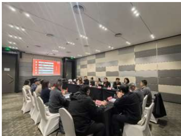
图一：公正性委员会研讨会

表明TASH能够按照公正性的相关政策和原则开展产品认证及相关事宜，评估分析公正性的威胁已经在可控范围内。抽查项目7份项目资料，未发现影响公正性的证据。公司运营正常，没有商业、财务和其他压力。未收到客户投诉和政府罚款等影响到 TASH 的信心和影响力的事件。