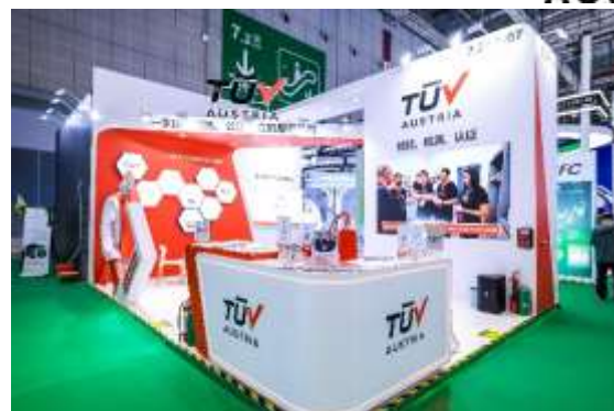
图十：第八届进博会