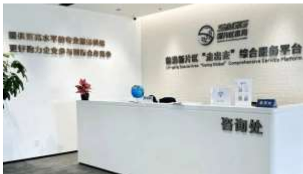
图九：“走出去”综合服务平台